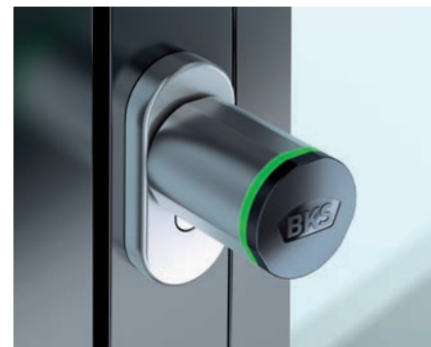
ixalo-Doppelknäufzylinder | RFID